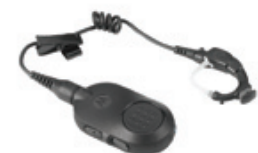
Drahtloses Zubehör für schwierige Einsätze

“Als ich die MOTOTRBO SL Reihe das erste Mal sah, dachte ich, es wäre ein Mobiltelefon. Es hat alle Fähigkeiten eines digitalen Handfunkgeräts, aber mit einem professionellen, diskreten Look, der wirklich gut zu unseren Uniformen passt.”